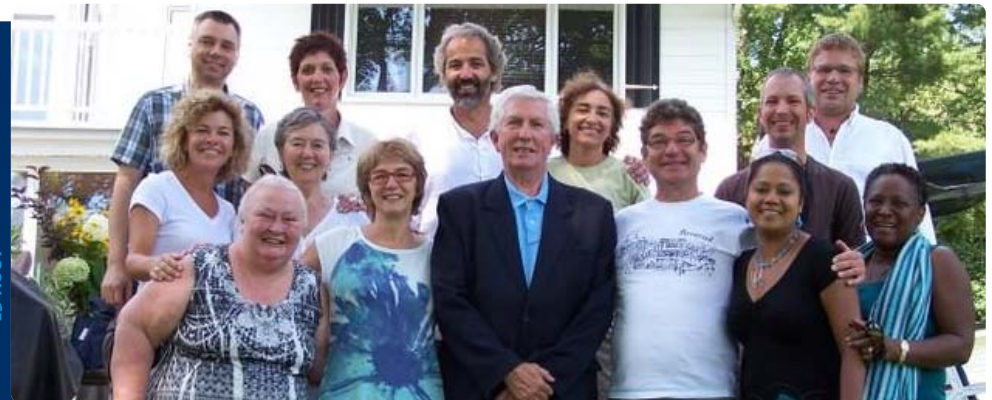
BBQ dans la circonscription de Joliette