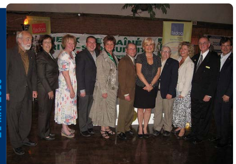
Jeux des aînés 2010