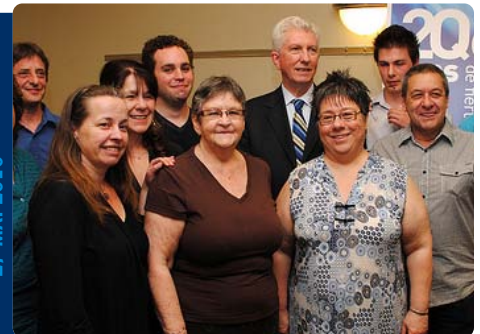
Assemblée générale du Bloc Québécois de Laurier-Sainte-Marie