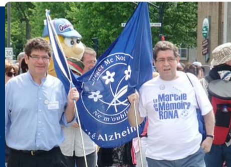
Marche de la Mémoire Rona à Joliette