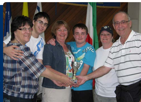
Rallye pédestre dans Rivière-des-Mille-Îles