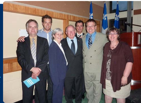
Cocktail dînatoire de Rimouski-Neigette-Témiscouata-Les Basques