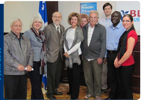
Assemblée générale dans Saint-Lambert