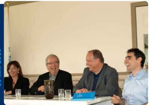
Café politiques organisé par le Bloc Québécois de Verchères-Les Patriotes