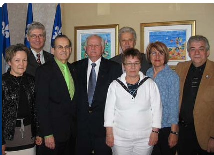
Assemblée générale annuelle du Bloc Québécois de Roberval-Lac-Saint-Jean